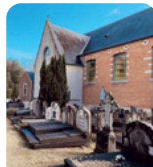
Het oude kerkhof verdient een renovatie.

Het oude kerkhof aan de kerk van Hever sloot lang geleden de deuren. In 1989 om precies te zijn. Het verdient een dringende renovatie. Samen met de provincie werken we een concreet plan uit, met respect voor de overledenen.