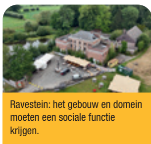
Ravestein: het gebouw en domein moeten een sociale functie krijgen.

Al sinds 2008 hebben het gebouw en domein van Ravestein geen echte bestemming. De gemeente heeft op dat vlak wel wat in te halen. Aan de voorkant willen we een evenementenweide voor de Zomerse Dinsdagen, de scouts, wandelaars, een sport- en speelpleintje. Ook voor de Ravesteinvissers blijft er plaats voorzien. Het domein moet dus een sociale functie krijgen. N-VA Boortmeerbeek wil graag dat de gemeente mee investeert in een culturele ruimte.