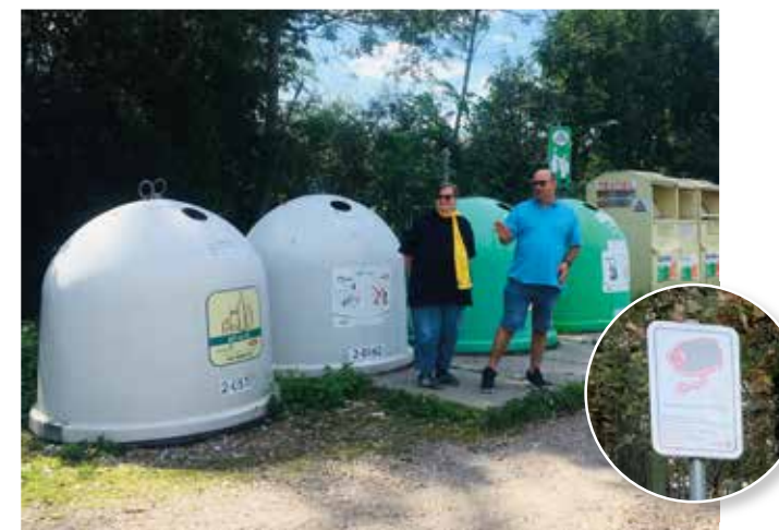
Aan enkele glasbollen in Boortmeerbeek staat een sluikstortcamera.

De strijd tegen sluikstorten stopt daarmee helaas niet. Heeft u nog suggesties, vragen of klachten: contacteer het gratis nummer van Ecowerf 0800 97 097 (tijdens werkdagen). We maken samen werk van een propere gemeente.