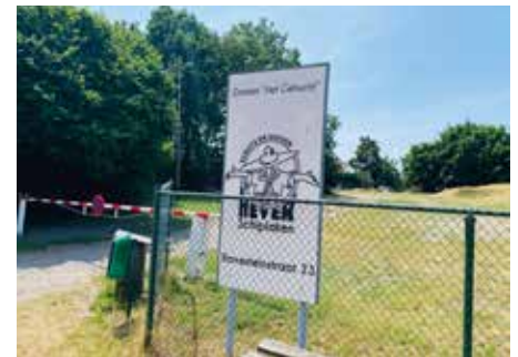
Jeugdverblijf Kalleberg in Hever kreeg Vlaamse subsidie.