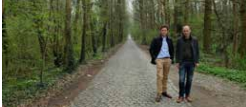
N-VA wil autoluwe Gottenijsdreef p. 2