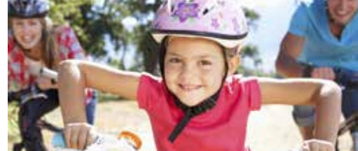
300 000 euro fietsinvesteringen p. 3